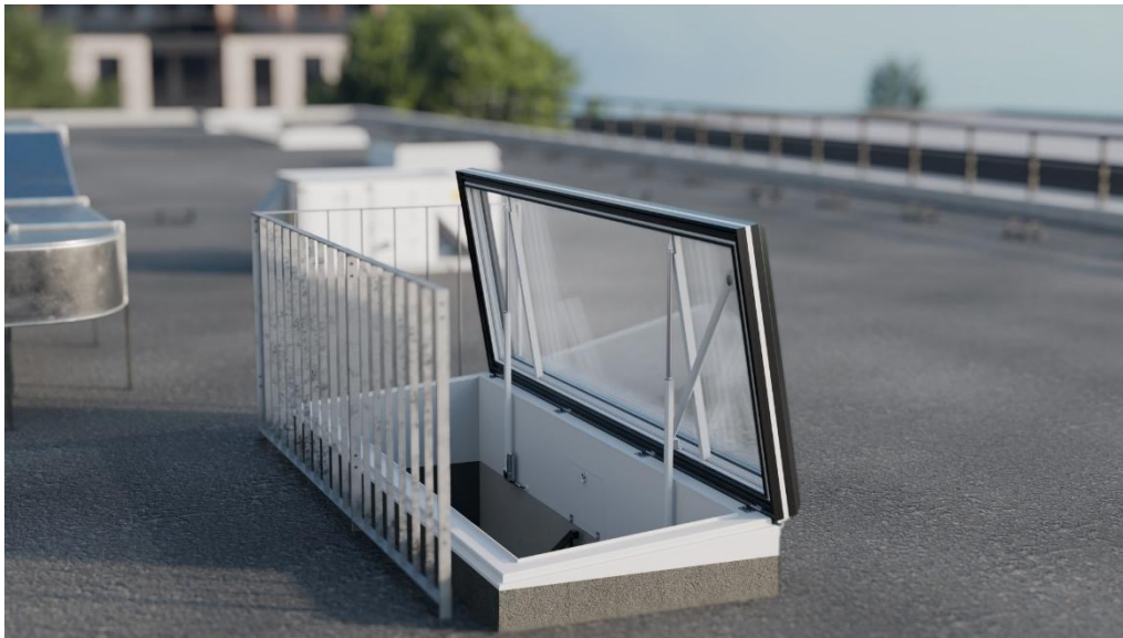
LAMILUX Produktneuheit: Der Flachdach Ausstieg Service FE